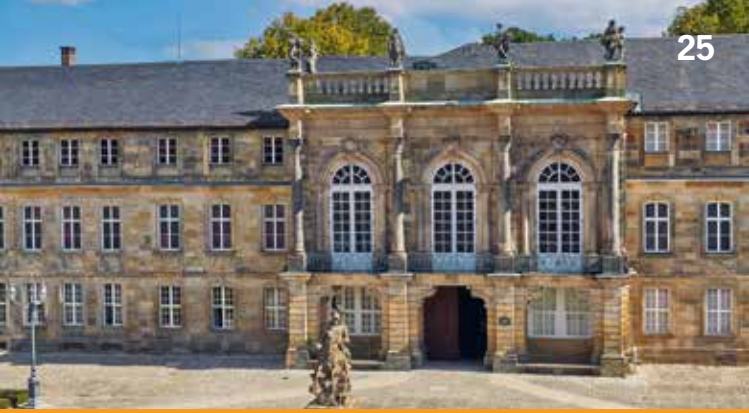
Fassade des Neuen Schlosses

Treffpunkt: Vortragsraum des Historischen Vereins, Ludwigstraße 25 b, 95444 Bayreuth