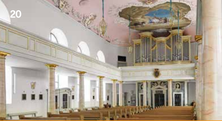
Innenansicht der 1758 geweihten Schlosskirche