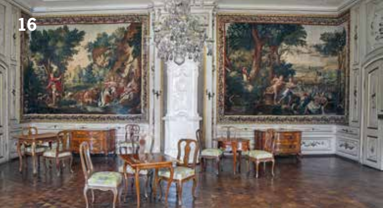
Gobelinsaal im Neuen Schloss