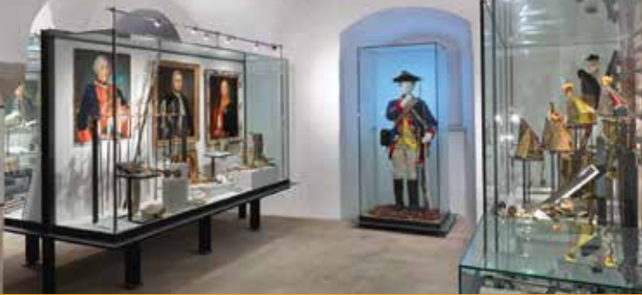
Armeemuseum Friedrich der Große