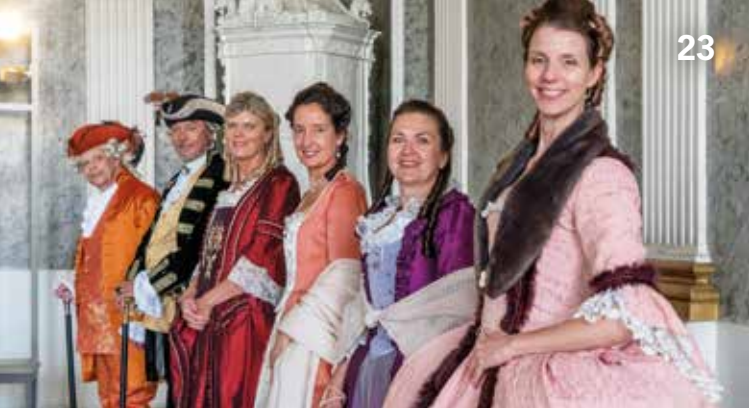
Mitglieder der Historischen Darstellergruppe Oberfranken e.V. in Aktion