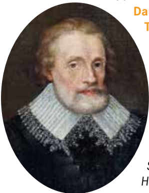
Selbstbildnis von Heinrich Bollandt

Mitveranstalter: Historisches Museum Bayreuth