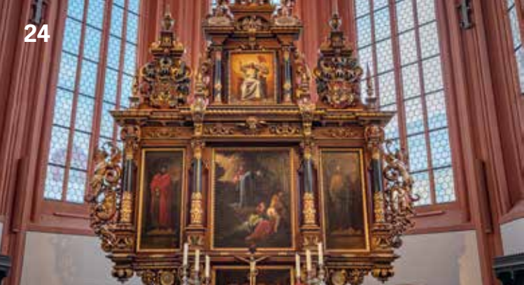
Altar der Stadtkirche zur Heiligen Dreifaltigkeit

Gemeinsam gestalten wir mehrere Pflanzkübel, die dann den ganzen Sommer im Hoheitengärtlein stehen werden. Worauf ist bei der Bepflanzung zu achten und wie wähle ich die passenden Pflanzen aus?