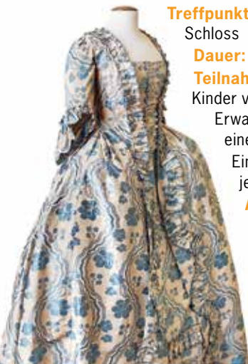
Mantelkleid im Teezimmer des Neuen Schlosses

Anmeldung: Tel. 0921 75969-21 oder an der Kasse im Neuen Schloss