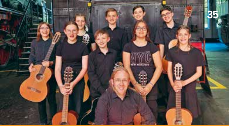
Gitarrenensemble des MGF-Gymnasiums