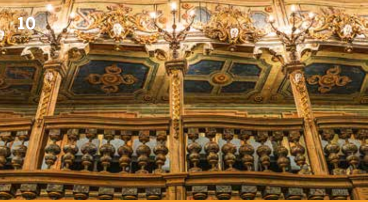
Erster Rang des Logenhauses