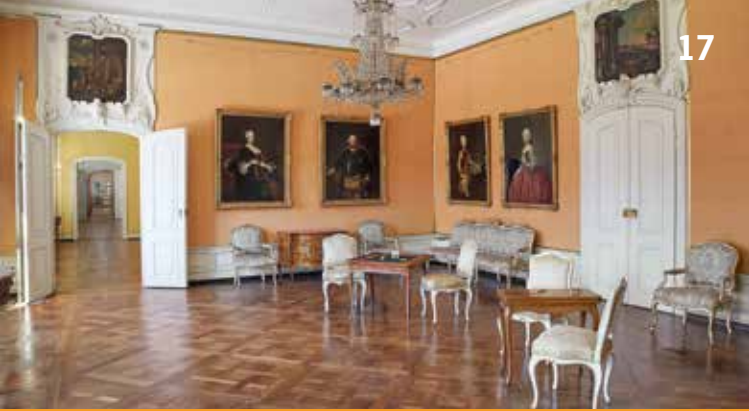
Preußisches Familienzimmer im Neuen Schloss