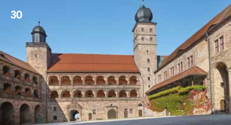
Schöner Hof mit Blick auf die westlichen Arkaden