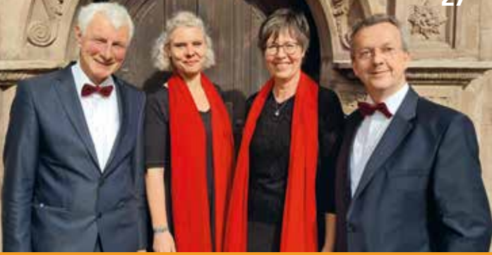
Das fränkische Gesangsquartett Vocalisto