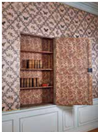
Wandschrank im Arbeitszimmer des Italienischen Schlässchens

Anmeldung: Tel. 0921 75969-21 oder an der Kasse im Neuen Schloss