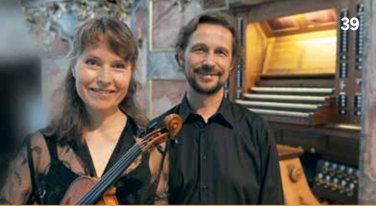
Duo violinorgano bamberg