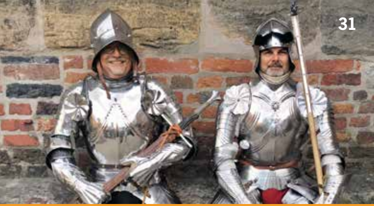
Mitglieder des Schwertbunds Nurnberg e.V.

Treffpunkt: Deutsches Zinnfigurenmuseum, Eingangsetage