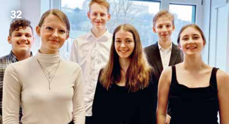
Schülerinnen und Schüler des Leistungsfachs Musik des MGF-Gymnasiums