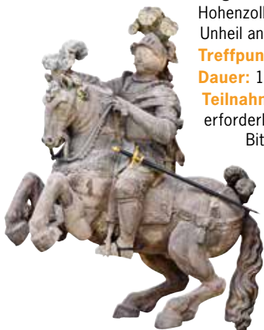
Reiterstatue des Markgrafen Christian

Trittsicherheit und festes Schuhwerk erforderlich