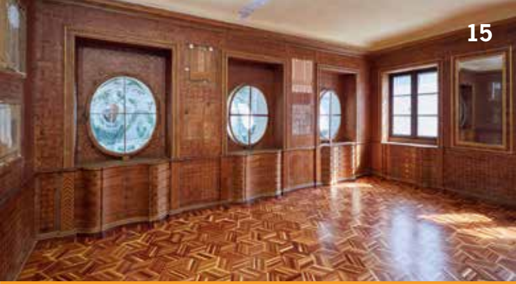
Rosenholzzimmer im Italienischen Schloßchen des Neuen Schlosses