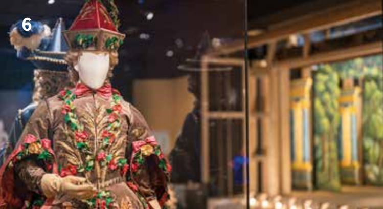
Rekonstruiertes Kostüm der Erde