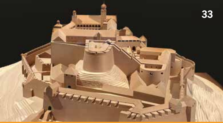
Architekturmodell der Plassenburg, um 1800

11.30– 16.30 Uhr Kurze Kunst-Gespräche im Museum Hohenzollern in Franken