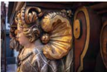
Detail des Altars der Stadtkirche Bayreuth

Veranstalter: Evang.-Luth. Pfarramt Stadtkirche Bayreuth