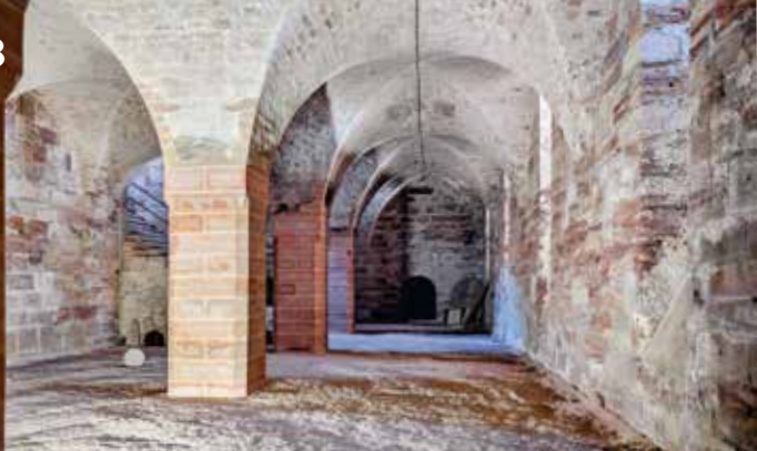
Weinkeller der Plassenburg

13.00– 17.00 Uhr Offene Mitmachstation für Klein & Groß Gut gezielt!