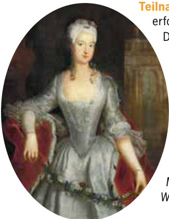
Markgräfin Wilhelmine, Werkstatt des Antoine Pesne