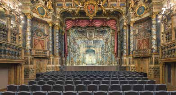
Blick in den Zuschauerraum des Markgräflichen Opernhuses