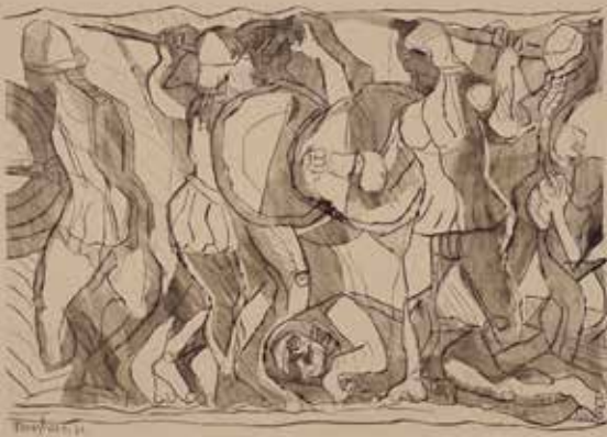
Eduard Bargheer, Kampf des Ares gegen zwei Giganten

Treffpunkt: Führungstreffpunkt Neues Schloss