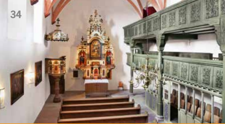
Schlosskirche der Plassenburg

12.00 und 14.00 Uhr Führung mit Orgelvorführung in der Schlosskirche »Dies ist das Kirchlein so geweiht der heiligen Dreifaltigkeit ...«