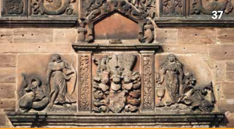
Giebel des Portals im Schönen Hof mit Wappen des Bauherrn

eingrichtet, improvisatorisch aufbereitet und in den Groove gebracht. Ergänzt wird das Programm durch virtuose tänzerische Variationssätze von Dalza, Ortiz und anderen.