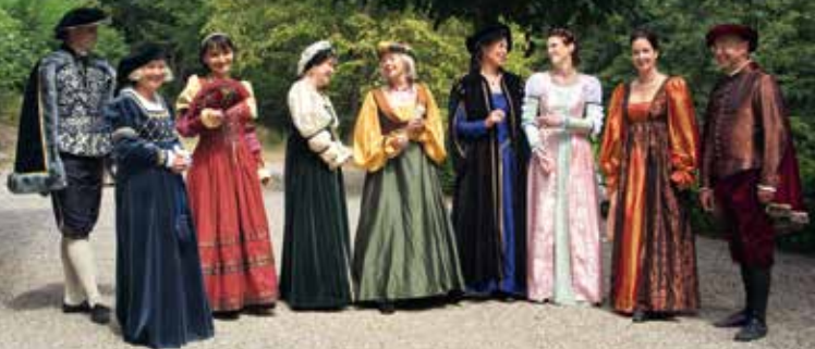
Renaissancetanzgruppe Spettacolo Cortigiano