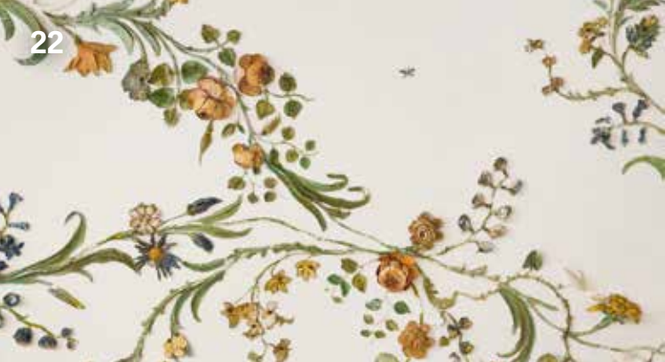
Blumenkabinett im Italienischen Schlösschen des Neuen Schlosses, Detail

Einblick in die praktische Gartendenkmalpflege anhand der Sanierung des Mohrengartens vor dem Italienischen Schlösschen.