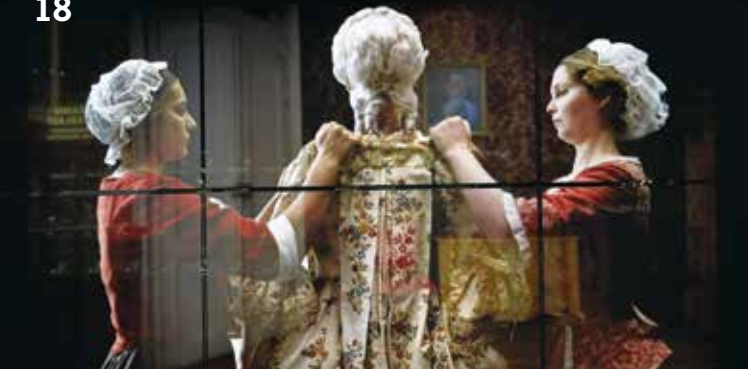
Medieninstallation zur Hochzeit der Markgrafentochter

Treffpunkt: Zugang Italienisches Schlösschen/ Staatsgalerie