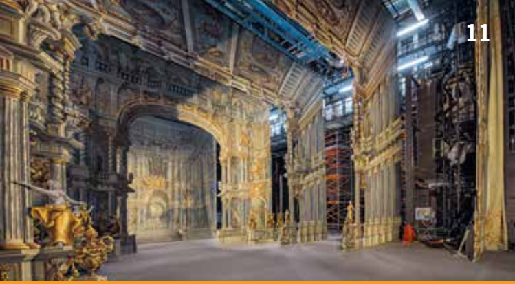
Blick in die Kulissen des Markgräflichen Opernhauses

Treffpunkt: Opernhausmodell (EG Markgräfliches Opernhaus)