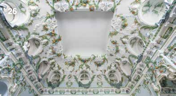
Gartensaal im Italienischen Schlösschen des Neuen Schlosses