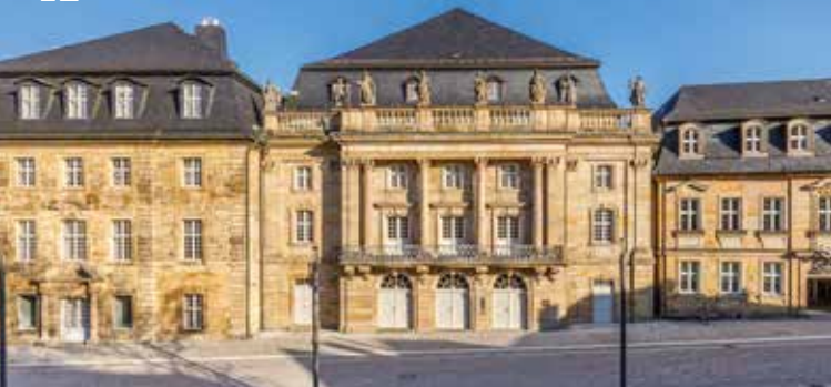
Blick auf die Fassade des Markgräflichen Opernhouses

Führung hinter die Kulissen des Opernhouses (max. 30 Führungsteilnehmer)!