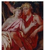
Acis und Galathea genießen ihre Zweisamkeit.